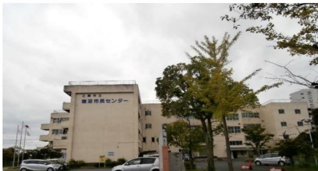
地域包括支援センターみずめまは瑞沼市民センターの中にあります。

主任ケアマネジャー・社会福祉士・保健師（経験のある看護師）の専門職が連携して、ご相談に対応します。